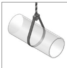
Pętla rurowa S